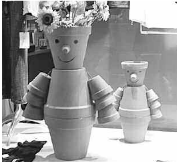
"Saksının başına saksı düşerse..."